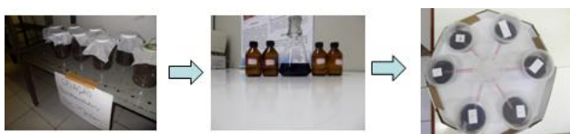
Figura 01 – Metodologia aplicada ao experimento

Cada arena constituiu em um bloco experimental, totalizando 10 repetições. As mesmas foram mantidas em sala climatizada e após 48 horas, verificou-se o número