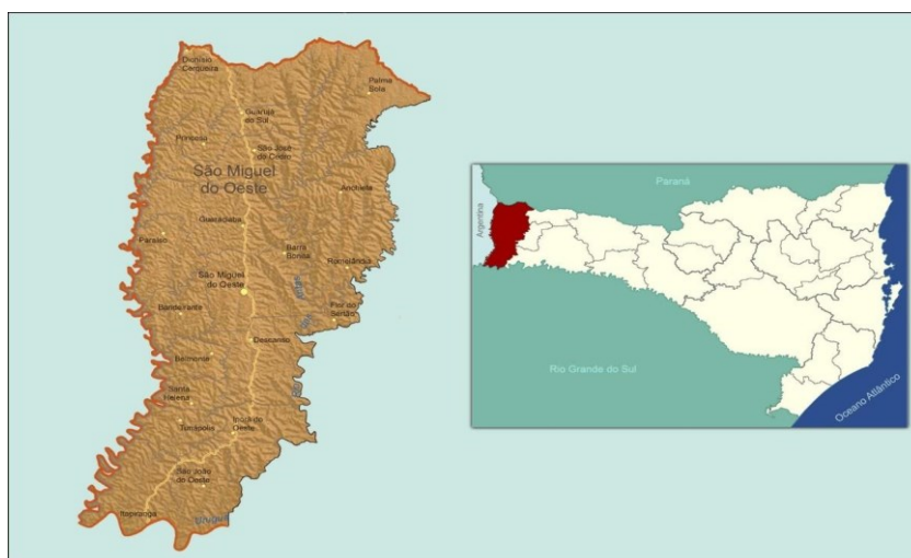
Figura 1 – Mapa adaptado da Região Imediata de São Miguel do Oeste

A colonização oficial do Extremo Oeste Catarinense (EOC) inicia na primeira metade do Século XX (Figura 1), ocupando a primeira gleba conferida a Brazil Railway Company como parte do pagamento pela estrada de Ferro São Paulo – Rio Grande. Sem considerar as populações ali já estabelecidas, os 327.765 hectares (ha) foram segmentados pela ação de empresas colonizadoras (Bavaresco; Franzen; Franzen, 2013). Essas buscaram atrair descendentes de imigrantes europeus com a oferta de novas terras a preços inferiores aos praticados nos locais de colonização mais antiga, especialmente, do Rio Grande do Sul. Os lotes comercializados eram, geralmente, de 25 ha (“colônias”), o que explica a estrutura fundiária marcada por estabelecimentos de pequenas áreas, nos quais a produção e gestão se assentam na família. Mesmo após o êxodo rural de muitas famílias, o Censo Agropecuário de 2017 registra um total de 13.497 estabelecimentos, cultivando 322.566 ha nos vinte municípios (IBGE, 2019), o que resulta em tamanho médio de 23,9 hectares.