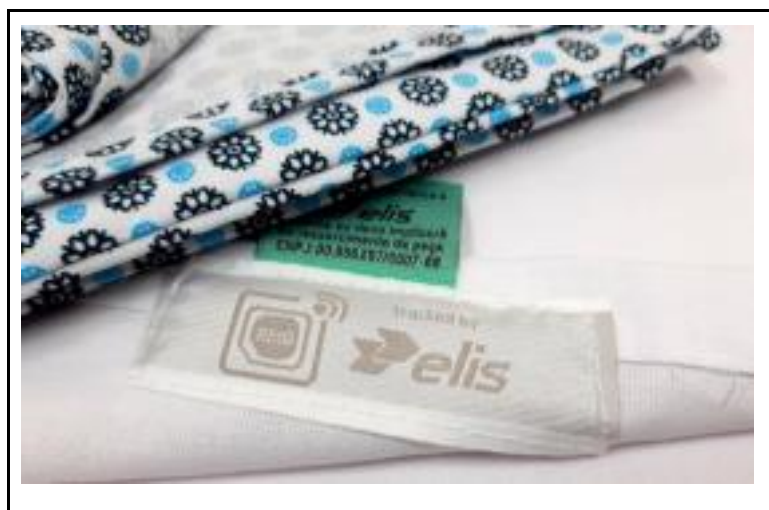
Figura 3 - Marcação de enxoval por meio do sistema RFID