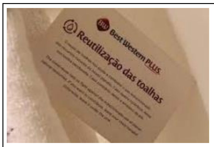
Figura 4 - Placa de divulgação da reutilização das toalhas