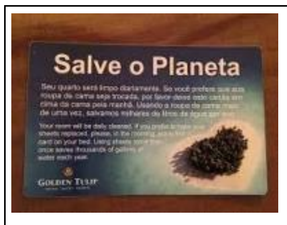
Figura 5 - Placa de divulgação da reutilização dos lençóis