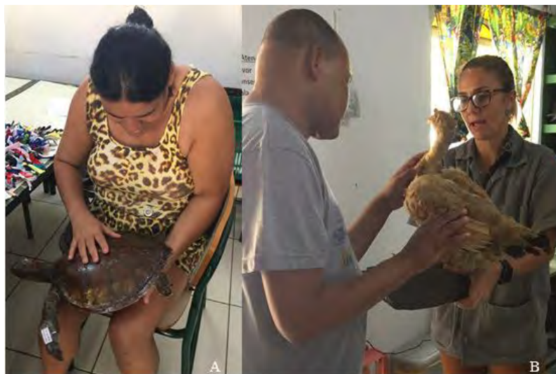
Figura 5 - Apresentação dos espécimes taxidermizados aos deficientes visuais do Educandário São José Operário. Abordagem científica sobre diferentes espécies de animais domésticos e silvestres: Tartaruga verde (A) e Galinha (B).