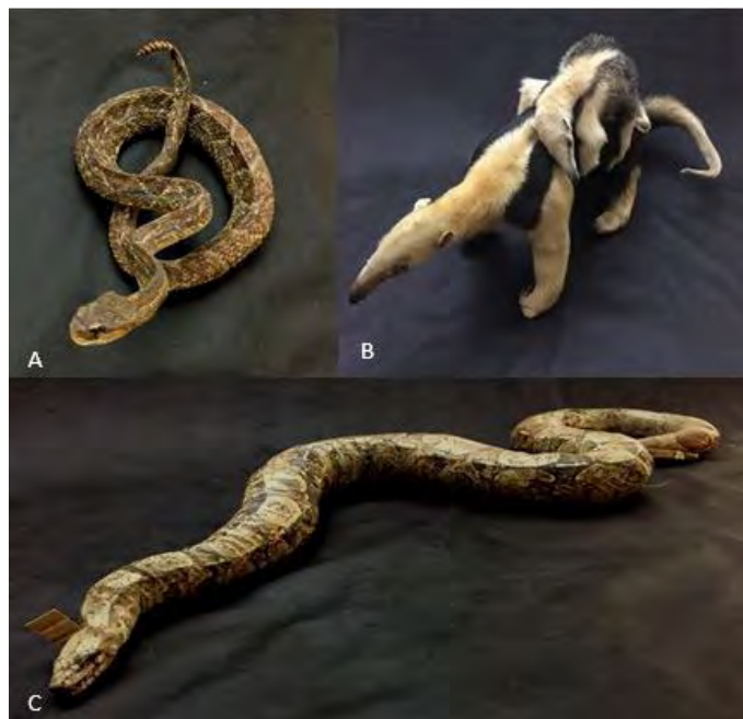
Figura 4 - Espécimes taxidermizados de uso para atividades de educação ambiental da Seção de Anatomia Animal/LMPA/UENF: Crotalus durissus : Cascável (A), Tamandua tetradactyla : Tamanduá-mirim (B) e Boa constrictor : Jibóia (C).

Teiú, Sagui-de-tufo-preto, Cão, Atobá-pardo, Tamanduá-Mirim, Galinha, Serpentes, Frango-d'água, Gavião-Carijó, Gavião-Carcará, Coruja-das-Torres, Quati e Guaxinim. Todo esse acervo foi trabalhado com o intuito de incorporar, no processo de ensino-aprendizagem de deficientes visuais, uma ferramenta didática alternativa e conhecimento científico, embasados no processo de educação ambiental (Figura 3).