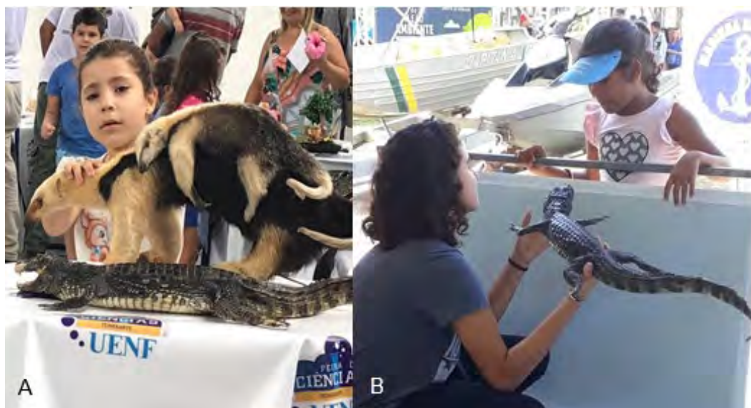
Figura 3 - Exposição de animais taxidermizados durante Feira de Ciência Itinerante da UENF, na Associação de Moradores do distrito de Espírito Santinho, Município de Campos dos Goytacazes-RJ (A), e na Feira de Ciência de São João da Barra - RJ (B).

Após seis meses do início das atividades das Feiras de Ciências Itinerantes, passamos a atender à demanda de diversos setores da sociedade (Figura 2).