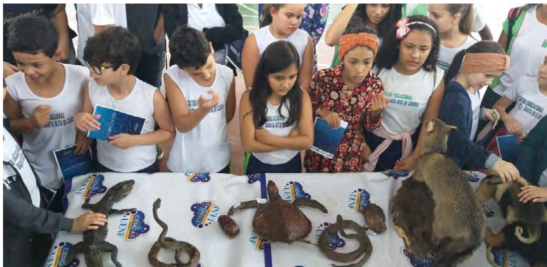
Figura 2 - Exposição de animais taxidermizados como ferramenta da educação ambiental na Feira de Ciência Itinerante, realizada no Município de Bom Jesus do Itabapoana - RJ.