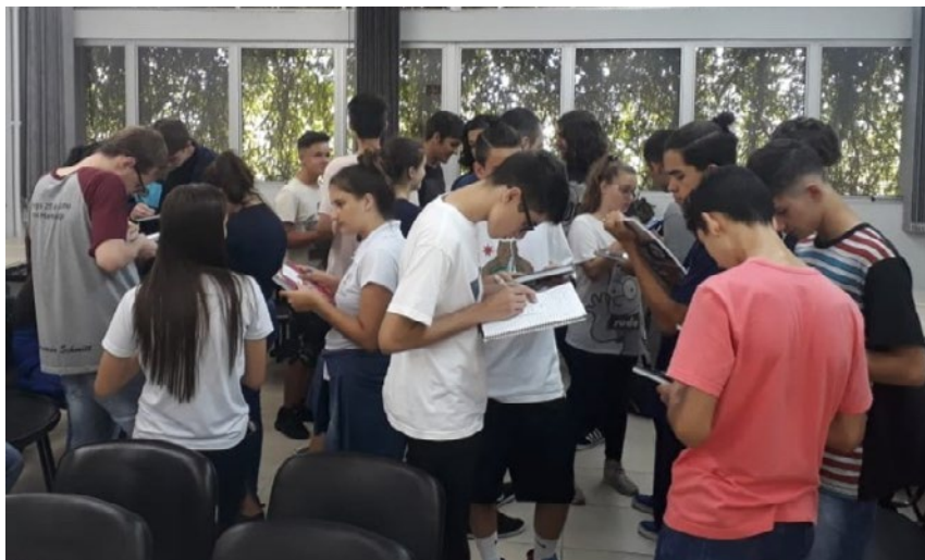
Figura 3: Os alunos realizando uma atividade de interação em duplas

Após finalizarem as escritas de suas biografias, os alunos puderam ler sua história pelo olhar do outro e ver como foram representados no papel, tendo em mente as reflexões feitas anteriormente.