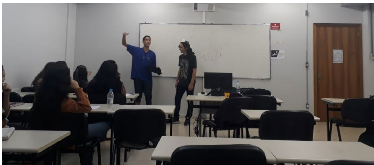
Figura 2: Alunos do projeto apresentando sua esquete teatral

Em um certo momento de sua palestra, Chimamanda questiona como seria a história do "descobrimento" da América (referindo-se aos Estados Unidos) se ela começasse a ser contada pelas flechas dos indígenas e não pela chegada dos britânicos. Utilizando essa mesma reflexão, os alunos foram instigados a pensar como seria a história do "descobrimento" do Brasil pelo olhar dos grupos indígenas da época. É clara a falta de informação sobre esse momento histórico, no que se refere à atenção ao ponto de vista dos indígenas, que são muitas vezes apagados historicamente. Utilizando a pesquisa e a criatividade, os alunos realizaram produções textuais, em diferentes linguagens e gêneros, mostrando esse outro lado do início da história de nosso país. Muito presente em suas produções estava a crítica à violência e exploração contra os grupos indígenas por parte dos colonizadores.