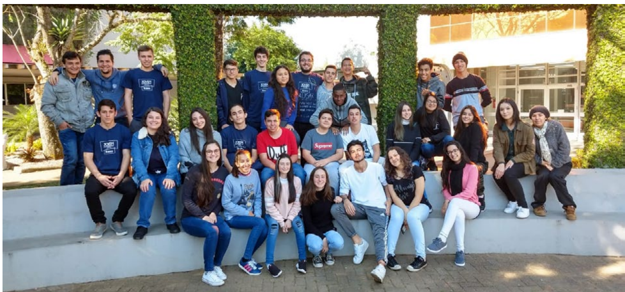
Figura 5: Uma das turmas no encerramento da oficina

As oficinas de Língua Portuguesa no Jovem Aprendiz constituíram-se momentos de interação e troca de saberes, na construção do saber inacabado, em um ambiente em que todos ensinam e todos aprendem, demonstrando ser possível trabalhar de forma crítica e libertadora dentro da sala de aula, assim como já haviam dito Paulo Freire (2014) e bell hooks (2017), escritores que tiveram grande influência na prática docente aqui descrita. Buscou-se sempre tornar o ambiente acolhedor para todos, dando-lhes espaço para expressar opiniões, discutir pontos de vista e, talvez mais importante, ouvir o que outro tem a dizer, na busca por uma sociedade mais equânime e empática.