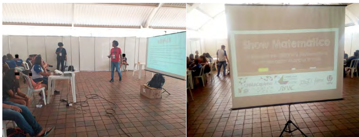
Figura 6: Show Matemático

Para fechar a tarde de atividades em cada dia do CNMACquinho, realizou-se o Show Matemático, que consistiu em uma dinâmica de perguntas e respostas, envolvendo raciocínio lógico, geometria básica e aritmética elementar. Os alunos foram divididos em equipes e, ao final, as equipes vencedoras receberam brindes como forma de premiação.