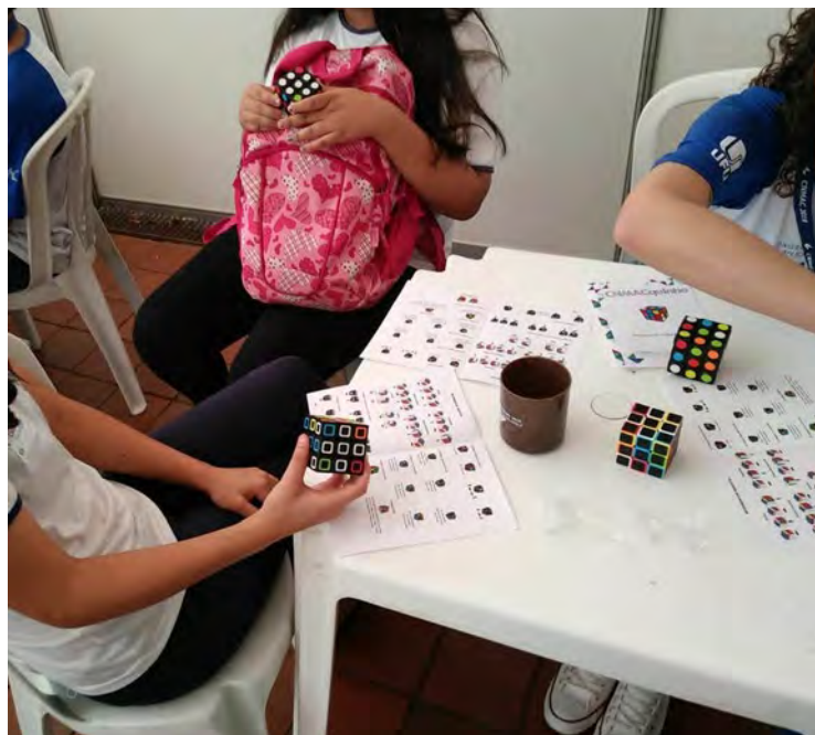
Figura 4: Oficina Cubo Mágico

Na “Oficina de Cubo Mágico”, foram trabalhadas técnicas para se resolver o tradicional cubo mágico 3x3, em etapas simples e explicativas. Uma das graduandas, dispoñdo das teorias de Cerpe (2014), elaborou uma apostila contendo instruções e ilustrações dos movimentos básicos e passos necessários para se resolver o cubo que ficou disponível aos participantes da oficina.