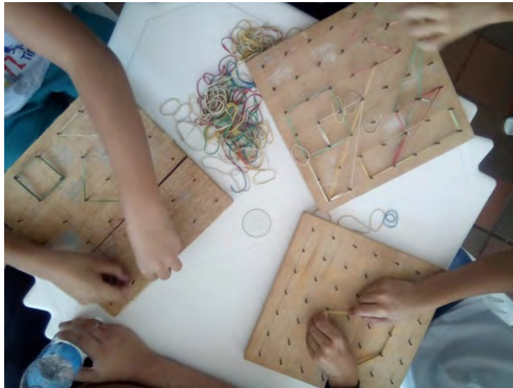
Figura 3: Oficina de Geoplano