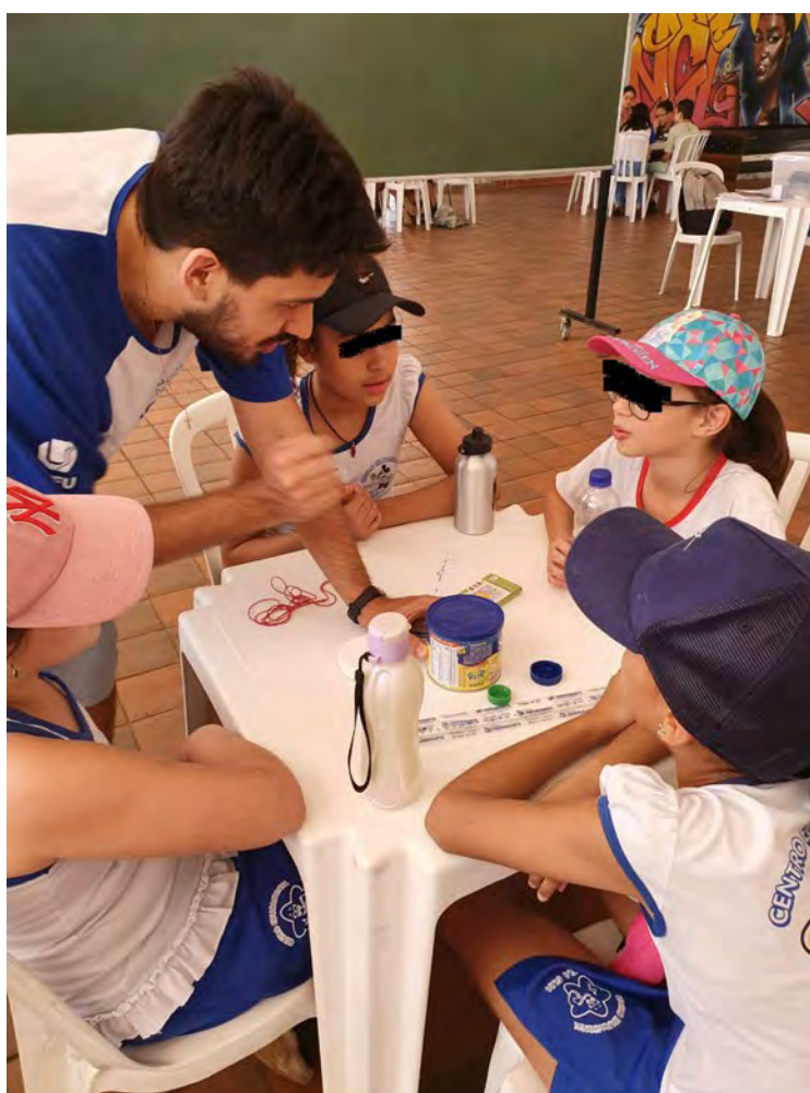
Figura 2: Oficina \pi re conosco

A partir do estudo de Machado (2013), elaboramos a “Oficina \pi re Conosco”, em que procuramos aliar o contexto histórico de como surgiu o número \pi à produção de estimativas para esse número, por meio da utilização de calculadora e materiais como barbantes, tampas e outros objetos circulares.