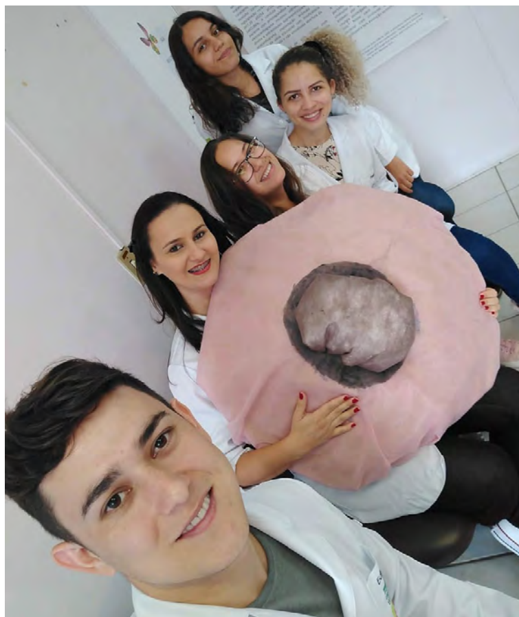
Figura 1: Protótipo de mama.

Durante a preparação para a atividade de educação em saúde, os alunos construíram um protótipo de uma mama gigante (Figura 1), na dimensão de um metro de diâmetro.