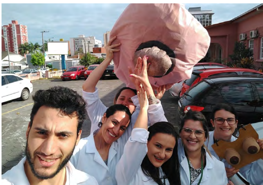
Figura 3: Alunos e Professoras do curso Técnico em Enfermagem