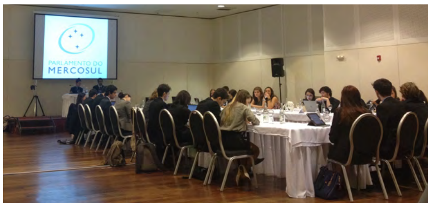
Figura 1: Simulação realizada no PampaSul 2015.

O PampaSul simulou, em sua primeira edição (2015), o Mercosul. Na ocasião, três comitês foram simulados: o Fórum de Convergência Estrutural para o Mercosul (FOCEM), o Fórum Consultivo Econômico e Social (FCES) e o Parlamento do Mercosul (ParlaSul). No FOCEM, foram elaborados dois projetos binacionais para melhora da infraestrutura dos países-membros do Bloco: Argentina, Brasil, Uruguai, Paraguai e Venezuela. No FCES discutiram-se os desafios para a integração produtiva do Bloco. Já no ParlaSul, ocorreu o debate sobre o problema do narcotráfico na região, em especial a proposta de políticas conjuntas para a contenção das Forças Armadas Revolucionárias da Colômbia (Farc).