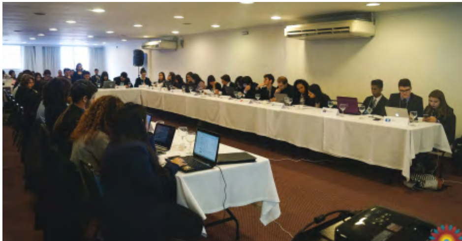
Figura 3: Simulação realizada no PampaSul 2017.

Em 2017, o PampaSul realizou a simulação simultânea de três importantes organizações: o Conselho de Chefes de Estado da Organização para Cooperação de Xangai (OCX), a Comissão Intergovernamental de Direitos Humanos da Associação de Nações do Sudeste Asiático (ASEAN) e a ASEAN+3 (incluindo China, Coreia do Sul e Japão). No primeiro comitê foi debatido o conflito separatista em Nagorno-Karabakh e, após discussões, os representantes da organização reforçaram as resoluções do Conselho de Segurança da Organização das Nações Unidas (ONU) acerca do tema, reiterando a importância de que a região em conflito fosse reconhecida pela Armênia e pela comunidade internacional como pertencente ao Estado do Azerbaijão.