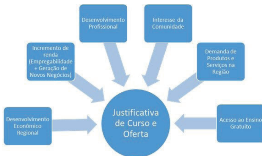
Figura 1: Eixos justificantes da oferta

O curso se justifica, portanto, em alguns eixos: Desenvolvimento Econômico Regional, Incremento de Empregabilidade e Novos Negócios, Desenvolvimento Profissional, Interesse da Comunidade, Demanda de Produtos e Serviços desenvolvidos na Região e Acesso Gratuito ao Ensino. Destaca-se, com relação à extensão, a demanda de produtos e serviços e, a partir da identificação de quais deveriam ser prioridade (ainda com a pesquisa realizada em parceria com a ACIC), foi construída a matriz curricular de forma a contemplar os interesses regionais.