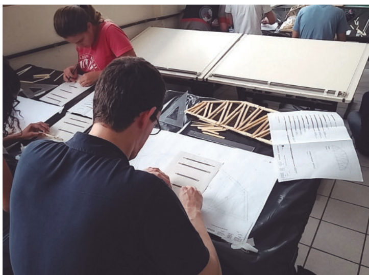
Figura 6: Projetos estruturais e executivos das pontes de palitos.

Além do comportamento estrutural, houve uma preocupação dos participantes com relação ao planejamento e execução da ponte (Figura 6).