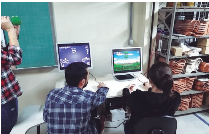
Figura 2: Alunos de graduação interagindo com o jogo.