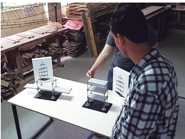
Figura 3: Análise do comportamento estrutural.

O aluno visitante pôde montar diferentes sistemas estruturais, visualizando os movimentos e deformações do conjunto de barras e nós e ter uma experiência sensorial do comportamento das estruturas interagindo diretamente com o modelo (Figura 3). Para tanto, foi utilizado um kit estrutural didático composto de molas e ímãs, o Mola Structural Kit, que simula o