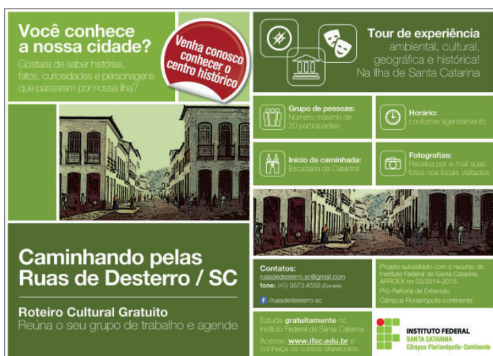
Figura 3: Flyer de divulgação.

Para a divulgação da oferta da caminhada turística gratuita, utilizaram-se os seguintes meios de comunicação: flyers , contatos telefônicos, fanpage no Facebook, criação de um e-mail específico do projeto ( ruasdedestero.sc@gmail.com ) e visitas “in loco”, realizando o convite aos participantes para o agendamento do roteiro. A Figura 3 apresenta o flyer utilizado para divulgação do projeto.