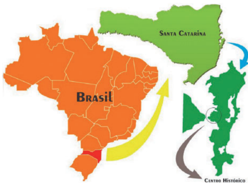
Figura 1: Localização do Centro Histórico em Florianópolis

De acordo com dados de um levantamento realizado pelo Ministério do Turismo (MTUR) em parceria com o Serviço Brasileiro de Apoio às Micro e Pequenas Empresas (Sebrae), em 2014, Florianópolis (Figura 1) encontrava-se como o décimo destino mais competitivo do país, atraindo turistas e visitantes de várias localidades do Brasil e do mundo. De acordo com Bueno, o território do município de Florianópolis, que abrange uma pequena porção continental e a Ilha de Santa Catarina, “é constituído por diversos ecossistemas naturais representativos do litoral brasileiro, conformando uma paisagem rica e agradável à vista de quem dela se aproxime” (2006, p.26).