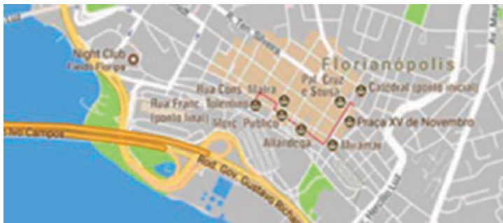
Figura 2: Roteiro realizado

“A valorização do bem patrimonial não é apenas pela sua história ou antiguidade, mas também, e principalmente, apoiando-se em valores e sentimentos de pertença da população em relação ao bem” (GOMES, 2008, p.170). “A riqueza turística de um território é dada pelo seu patrimônio cultural e natural, o qual é estratégico integrar a sua proteção e valorização dentro da perspectiva de desenvolvimento”. (GONZÁLEZ; MARTINEZ, 2010, p.5). Assim, o roteiro definido envolveu 6 locais de memória: Catedral, Praça 15, Mercado Público, Miramar, Largo da Alfandega e Casario da Conselheiro Mafra, conforme Figura 2: