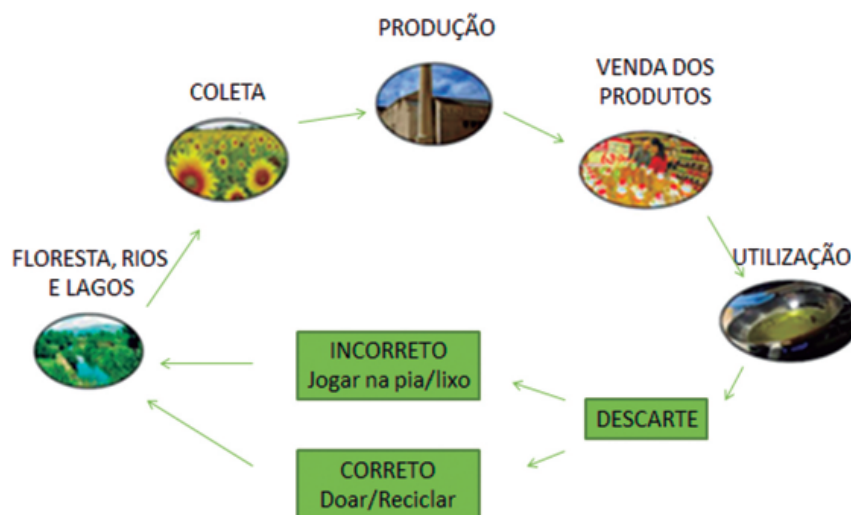
Figura 2: O ciclo do óleo.

Durante essas aulas, foi mostrada a química envolvida na reação de saponificação (Figura 3).