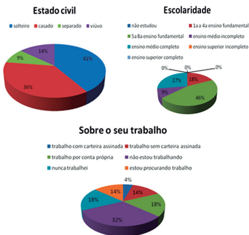
Figura 1: Perfil socioeconômico realizado com um grupo de 25 mulheres moradoras de Antônio Pereira, distrito de Ouro Preto.

Posteriormente, o curso passou a ser ministrado em Antônio Pereira, distrito de Ouro Preto. O local foi escolhido porque recebe pouco investimento público e, conseqüentemente, está à margem da sociedade. Enfrenta problemas sociais graves como: baixo nível de escolaridade da população, alto índice de violência e, principalmente, o registro de muitos casos de violência contra a mulher. Além disso, segundo Censo realizado em 2010, o distrito possui cerca de 4,5 mil habitantes, sendo composto por 49,60% de mulheres (LELIS, 2012). Várias delas são mães solteiras, não concluíram o Ensino Médio e não estão inseridas no mercado de trabalho (Figura 1).