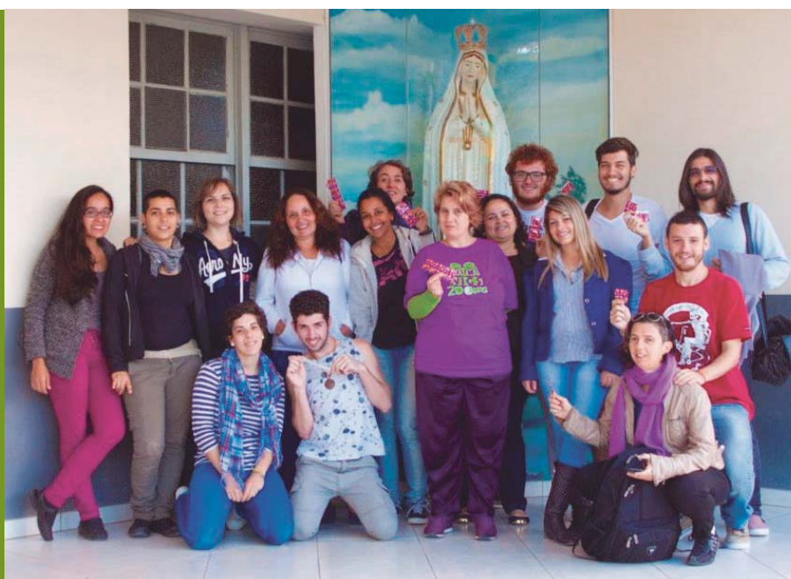
Imagem 3: Bolsistas PIBIC

A partir de estímulo da coordenação, alguns bolsistas participaram de projetos coletivos e individuais como: a) a elaboração da primeira Cartilha de Prevenção às Violências Sexistas, Homofóbicas e Racistas nos Trites Universitários 7 , que envolveu toda a equipe do NIGS como forma de denúncia e resistência aos trites violentos que ocorrem regularmente na entrada de estudantes na universidade; b) a elaboração de ilustrações para a cartilha, por parte de um estudante do projeto. Tal fato foi considerada uma experiência importante de articulação conceitual e estética da proposta do projeto Papo Sério e; c) pesquisas empíricas sobre violências, onde os resultados foram apresentados posteriormente em eventos científicos e os alunos participaram do 7º e o 9º Prêmio Construindo a Igualdade de Gênero , com textos abordando a temática das violências de gênero.